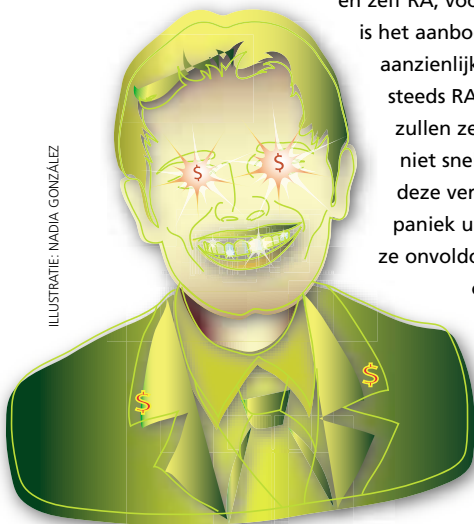
ILLUSTRATIE: NADIA GONZÁLEZ

geldbuidel te trekken om voldoende RA's binnen te halen. Maar uiteindelijk krijgt de opdrachtgever van die kantoren, het bedrijfsleven, hiervoor de rekening gepresenteerd. Ik betwijfel zeer of ondernemingen bereid zullen zijn om die hogere tarieven te betalen. Accountantskantoren zullen door de markt worden gedwongen om hun tarieven en dienstengevolge de salarissen van hun medewerkers binnen de perken te houden." (AB)