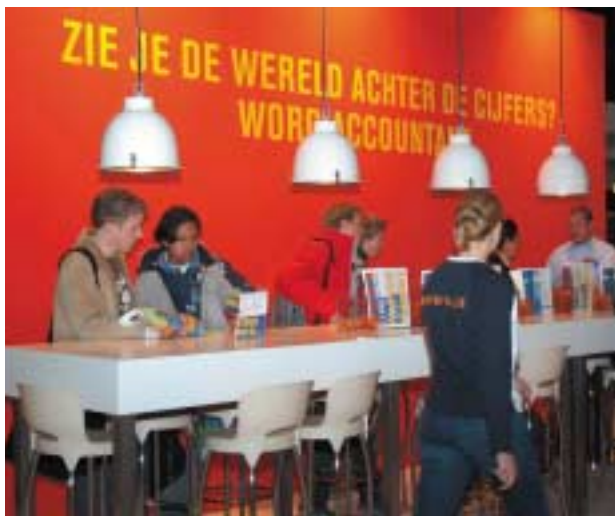
De stand van het accountantsberoep 'Check de cijfers' werd tijdens de Studiebeurs in Utrecht van 13 tot en met 16 oktober 2004 druk bezocht.

Op basis van de recente gegevens zal het NIVRA haar inspanningen op het gebied van de arbeidsmarktcommunicatie aanpassen.