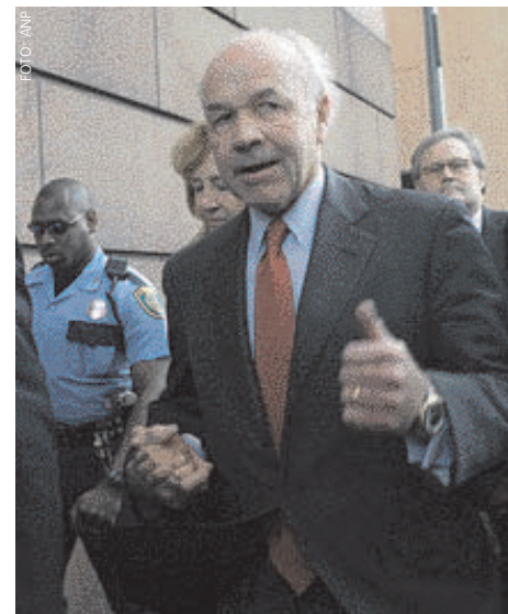
Oud-Enron-topman Kenneth Lay.