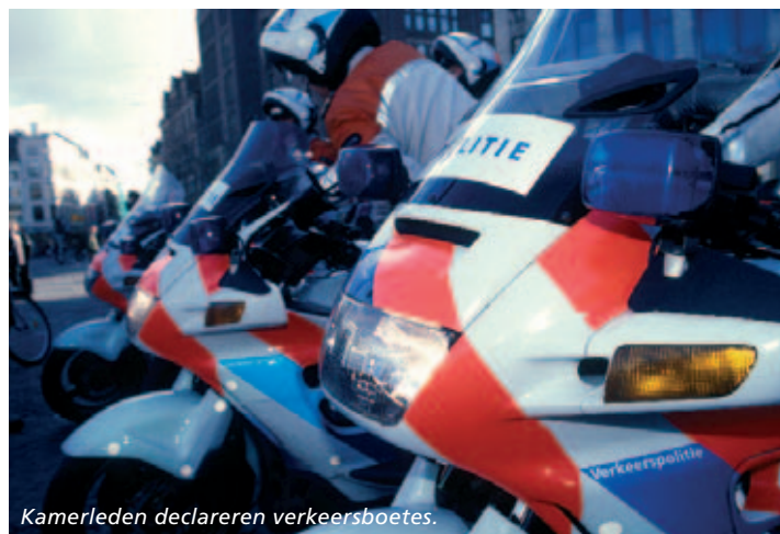
Kamerleden declareren verkeersboetes.

Het United Nations Development Programma (UNDP) heeft van Deloitte US Financial Advisory Services het eindrapport ontvangen over de besteding van de tsunami-hulpgelden. Deloitte had deze bijdrage pro bono aangeboden. Het kantoor heeft naar eigen zeggen in 2005 tussen april en november ruim zestig specialisten uit VS, Australië, Canada, India, Indonesië, Singapore en Thailand bij dit project ingezet, voor in totaal veertienduizend uur.