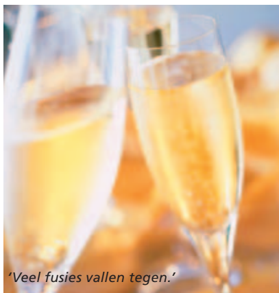
"Veel fusies vallen tegen."