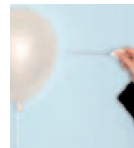
TEKST NART WIELAARD & TOM NIEROP

Hier is maar één echt harde conclusie mogelijk: de conclusies van McKinsey zijn op zijn best flinterdun.