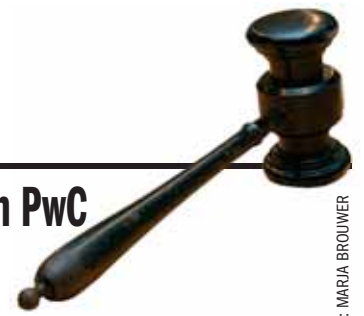
BEELD: MARIA BROUWER