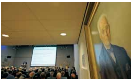
BEELD: MARIA BROUWER