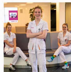
Collega's van Noordanus van het Sint Antonius Ziekenhuis kregen nationale bekendheid met hun serie foto's over hun werk tijdens de coronacrisis op Instagram: @breathtakingnurses.

➤ interessant en leuk. Ik dacht: als ik het nu niet doe, doe ik het nooit meer."