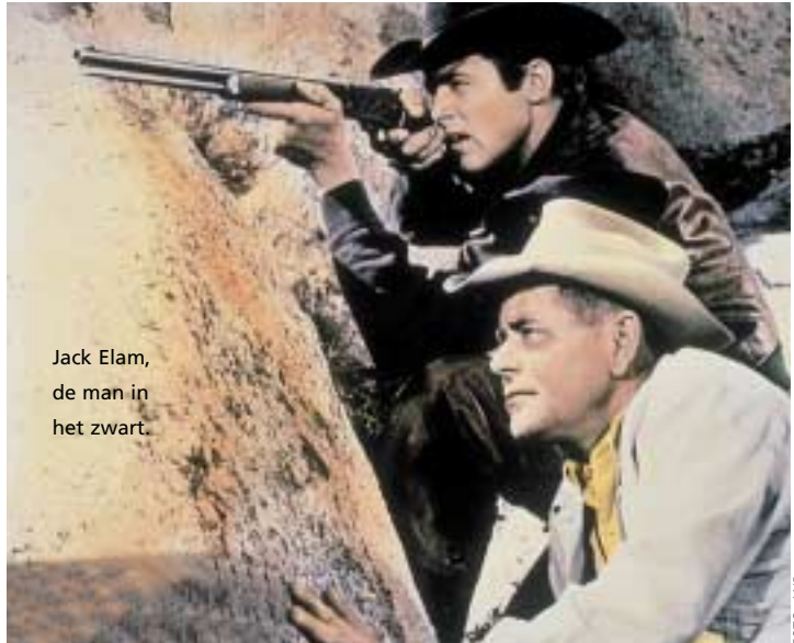
Jack Elam, de man in het zwart.