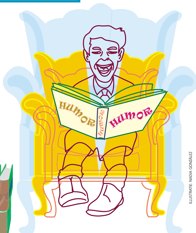
ILLUSTRATIE: NADIA GONZÁLEZ