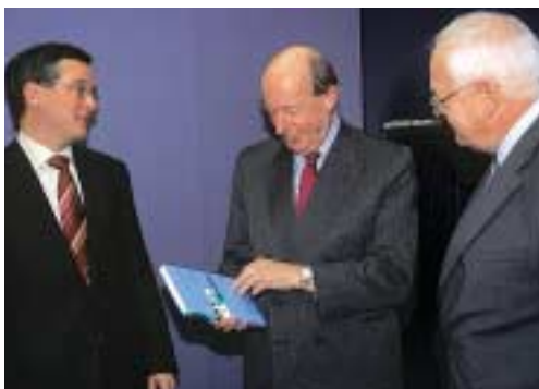
Jacques Schraven, voorzitter VNO-NCW (midden), neemt het eerste exemplaar van het rapport 'Het jaar 2002 verslagen' in ontvangst.

Met de publicatie wil het NIVRA wijzen op de gebieden waar zich belangrijke en actuele ontwikkelingen voordoen en aangeven welke consequenties dat heeft voor de praktijk. Hoogendoorn: "Daarbij wijzen we uiteraard op eventuele gebreken, met name om er lering uit te trekken." 'Het jaar 2002 verslagen' is in boekvorm verschenen en verkrijgbaar bij de bibliotheek van het NIVRA onder vermelding van bestelnummer 573.