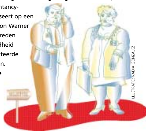
ILLUSTRATIE: NADIA GONZÁLEZ

Professionals met ernstig overgewicht komen moeilijker aan een baan dan slankere exemplaren. Voor dikke accountants blijkt het leven extra moeilijk. Althans in Groot-Brittannië. Neemt gemiddeld een kwart van de 'professionele' bedrijven daar liever geen zwaarlijvige kandidaten aan, bij accountantskantoren is dat zelfs een derde. Alleen de PR- en marketingwereld is nog terughoudender: 48 procent. Dit meldt Accountancy-magazine, dat zich baseert op een onderzoek door Manson Warner Health Care. Officiële reden voor de terughoudendheid is de vrees voor gerelateerde gezondheidsproblemen. In de advocatuur is die angst opvallenderwijs veel geringer. Slechts vijf procent zegt daar dikke sollicitanten liever te mijden.