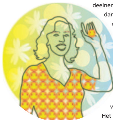
ILLUSTRATIE: NADIA GONZÁLEZ

Over de werkdruk en perspectieven van jonge accountants is veel te doen. Maar ook bij aanpalende professionals speelt dit onderwerp. Zoals bij de advocaten. De Stichting Jonge Balie Nederland temperde de huidige situatie met een onderzoek ('de Arbeidsvoorwaardenmonitor') onder 1.445 jonge exemplaren. Tweederde van de