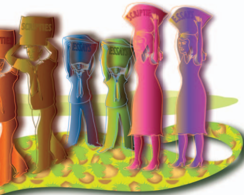
ILLUSTRATIE: NADIA GONZÁLEZ