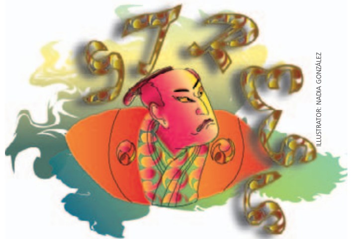
ILLUSTRATOR: NADIA GONZALEZ

In een persbericht van 5 april 2006 meldt het effectenhuis Van der Moolen een tender te organiseren voor accountantskantoren om het lopende financiële boekjaar 2006 te controleren. In het bericht wekt het bedrijf de indruk die keuze zelf te hebben genomen, onder meer uit kostenoverwegingen. Opvallend is echter dat huidig huisaccountant PricewaterhouseCoopers 'om een aantal redenen' heeft laten weten daaraan niet mee te doen. De opvallendste van die redenen: het high level of audit risk (hoge controlerisico).