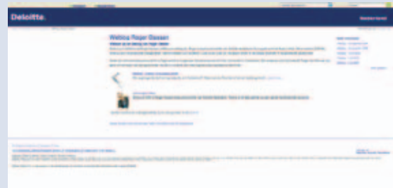
'Eerste weblog van Nederlandse accountant.'

Is het een overschatte hype of de moderne manier van direct en snel communiceren met stakeholders? Eén ding is zeker: Nederlandse accountants zijn geen fanatieke webloggers (zie 'de Accountant', maart 2006). Sinds 9 juni 2006 is dat echter voorbij, althans voor één prominente accountant. Deloitte-voorzitter Roger Dassen publiceert sinds die dag met regelmaat een eigen weblog ( www.rogerdassen.nl ). Erg veel opmerkingen over vergaderingen, lunches, bezoeken en lezingen uiteraard. Ook verrassende zaken duiken af en toe op, zoals "een boeiende presentatie van drie stagiairs (in vol militair tenue) van de Nederlandse Defensie Academie die ons adviezen gaven over hoe we de discipline in de organisatie kunnen versterken". Ook Dassens visie op de kabinetcrisis kwam voorbij in een zinnetje.