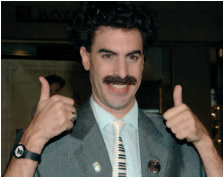
Borat: 'Accountants gevraagd.'