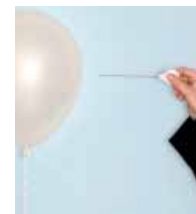
TEKST NART WIELAARD & TOM NIEROP

De berekening staat of valt met de aanname - op basis van internationale data - dat een mensenleven zo'n 80.000 euro per verloren jaar aan leed oplevert. Nog afgezien van hoe arbitrair dat is - door het rijksvaccinatieprogramma wordt bijvoorbeeld een jaarbedrag van 18.000 aangehouden - speelt ook de vraag of leed een schadepost is voor de maatschappij. Het lijkt een wat vreemde redenering: leed is toch per definitie een persoonlijk iets? Dan is er dus geen sprake van maatschappelijke kosten?