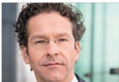
Keynote: Jeroen Dijsselbloem minister van Financiën

Hoeveel maatschappelijk krediet heeft de accountant nog? Draait alles om regelgeving, handhaving en kwaliteitsbeheersing? Maar hoe zit het dan met innovatie en technologie? En welke invloed heeft dat op traditionele besturings- en verdienmodellen?