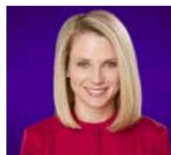
Marissa Mayer, ceo Yahoo

Wie er straks ook in het Witte Huis zetelt, zeker is dat het een blonde wereldleider wordt.