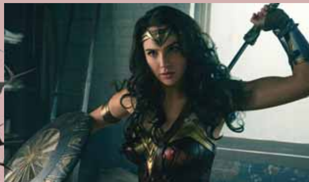
Wonder Woman is vanaf 11 oktober verkrijgbaar op 4K UHD, (3D)Blu-ray, DVD en via VOD.